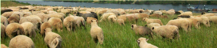
Schafherde an der Mosel

In Deutschland gibt es erste und sehr innovative Initiativen, die soziale Arbeit mit Schafhaltung verbinden . Darunter sind auch solche, die die Pflege von Menschen mit der Pflege von Natur und Landschaft kombinieren – insbesondere in der Organisationsform „Wanderschäferei“.