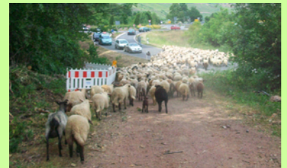
Schafe und Jugendliche, Treiben der Schafherde