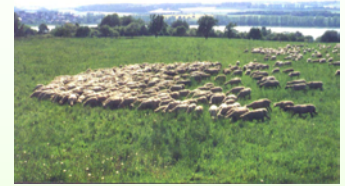
Schafherde bei Borken/Nordhessen

Den Sommer über halten sich die Schafe in 69 ha von insgesamt 182 ha des seit 1995 ausgewiesenen Naturschutzgebietes „Streuobstwiesen Wehlen“ auf. Hier wurden 4000 alte Obstbäume mit überwiegend alten und traditionell beheimateten Obstsorten gezählt. Dort kommen 240 Pflanzenarten (höhere Pflanzen), 79 Vogelarten (davon 17 auf der Roten Liste) sowie 209 Tag- und Nachtfalterarten (23 auf der Roten Liste) vor. Das Arteninventar der Streuobstwiesen soll aus ca. 3000 Tierarten (überwiegend Insekten) bestehen. In dieser schönen und wertvollen Umgebung ist Raum für die persönliche Entwicklung der Jugendlichen. Neu angekommen leiden diese meist unter Minderwertigkeitskomplexen. Die Erfahrung, dass ihnen die ganze Herde Schafe bereitwillig folgt, stärkt das Selbstbewusstsein genauso wie die Erfahrung, dass sie durch das Treiben hinter der Herde in der Lage sind, die ganze Herde nach vorne zu bewegen.