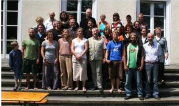
Gründungsversammlung in Kassel

der Buschberghof, die Soziale Landwirtschaft betreiben.