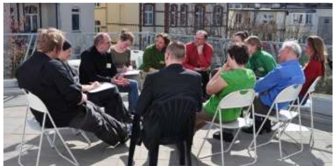
Arbeitsgruppe Aus- und Weiterbildung