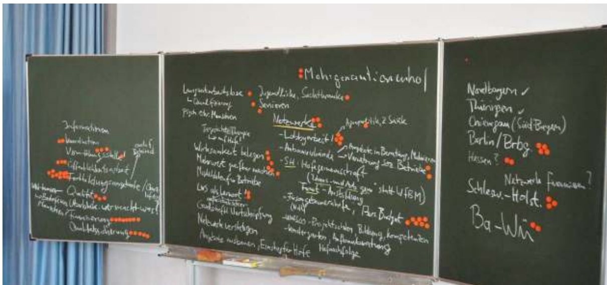
Tafelbild mit Priorisierung von Themen für die Arbeitsgruppen durch die Teilnehmer

und der sozialpolitische Bereich existiert unter dem Leistungstyp „Lebens- und Arbeitsgemeinschaften“. Dies ist eine Besonderheit in Schleswig-Holstein, dass eine Einrichtung, die keine WfbM sein will, als „Lebens- und Arbeitsgemeinschaft“ als vergleichbarer Leistungstyp anerkannt ist wie eine WfbM. Dadurch sind bewegliche und förderliche Möglichkeiten in den eigenen Strukturen gegeben, es muss nicht formalen Strukturen wie in der WfbM gefolgt werden. Die Vielfalt und Flexibilität sind sehr gefragt als Instrument in der Sozialarbeit in Deutschland. Die starren Strukturen haben große Schwierigkeiten, den Anforderungen in Deutschland gerecht zu werden. Vor 12 Jahren wurde als die sozialtherapeutische Zusatzqualifikation „FAMIT“ 2 eingerichtet, die der eigenen Struktur gerecht wird, eine. Diese Ausbildung befasst sich damit, das derzeitige Berufsbild in der Vorstellung der gegebenen Arbeit zu etablieren und Menschen zu qualifizieren, dieses Berufsbild überhaupt ausüben zu können. Die FAMIT-Ausbildung ist nur in Schleswig-Holstein als Qualifikation anerkannt.