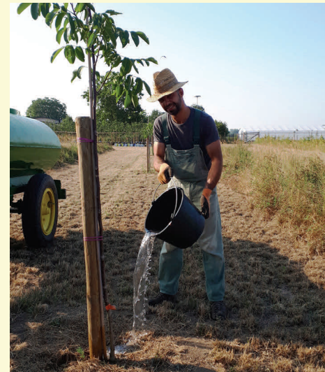
Bild 1: Soziale Landwirtschaft schafft Mehrwerte durch Integration unterschiedlicher Zielgruppen.

Zum Projektende sollten Schritte besprochen werden, wie es weitergeht: Lassen sich Projektergebnisse für eine Umsetzung nutzen? Wie kann das Netzwerk der OG weiter gepflegt und evtl. erweitert werden? Welche Ressourcen sind für eine Verstärkung der Arbeit nutzbar?