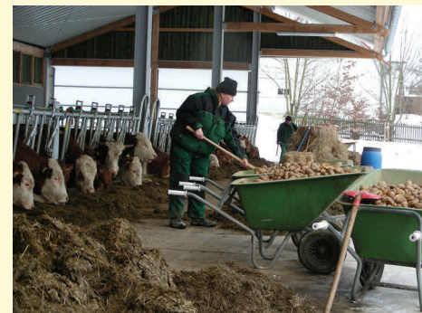
Bild 2 Handarbeitsintensive Arbeiten vermitteln Erfolgserlebnisse und tragen zum Betriebseinkommen bei.